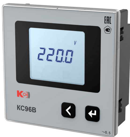
Рисунок 8 – Общий вид приборов KC96B (однофазная модификация)