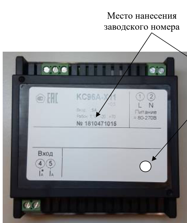
Рисунок 12 – Общий вид приборов KC96A (однофазная модификация). Вид сзади