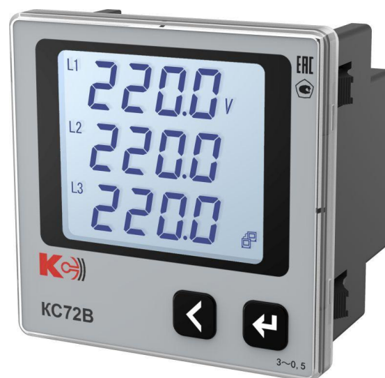
Рисунок 7 – Общий вид приборов KC72B (трехфазная модификация)