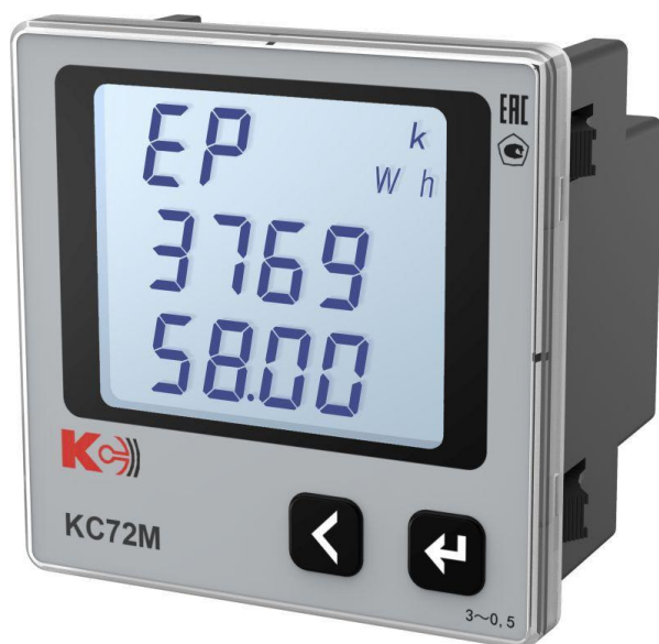
Рисунок 10 – Общий вид приборов KC72M