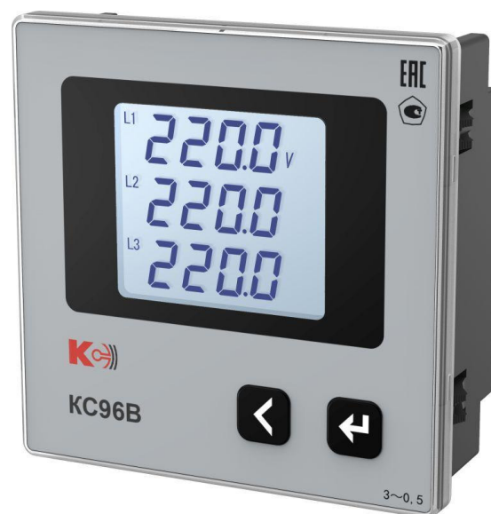
Рисунок 9 – Общий вид приборов KC96B (трехфазная модификация)

Заявитель ООО «К-С», Генеральный директор Испытатель ФГБУ «ВНИИМС», Зам.начальника отдела 201/3