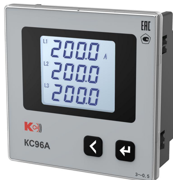
Рисунок 5 – Общий вид приборов KC96A (трехфазная модификация)

Заявитель ООО «К-С», Генеральный директор Испытатель ФГБУ «ВНИИМС», Зам.начальника отдела 201/3