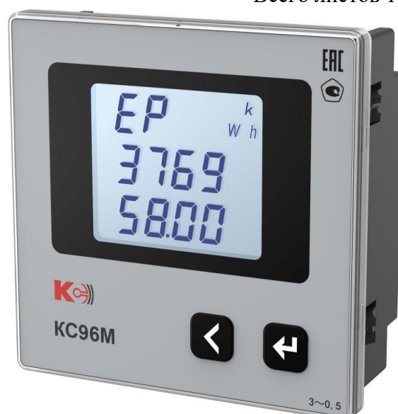
Рисунок 11 – Общий вид приборов KC96M