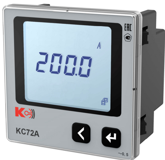
Рисунок 2 – Общий вид приборов KC72A (однофазная модификация)