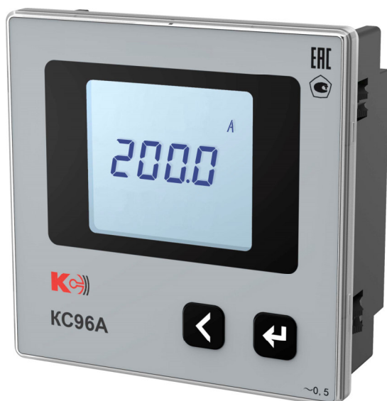
Рисунок 4 – Общий вид приборов KC96A (однофазная модификация)