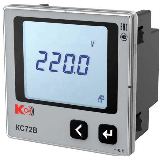
Рисунок 6 – Общий вид приборов KC72B (однофазная модификация)