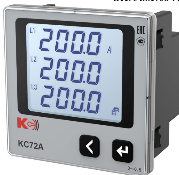
Рисунок 3 – Общий вид приборов KC72A (трехфазная модификация)