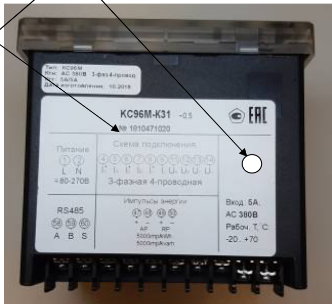
Рисунок 14 – Общий вид приборов КС96В. (трехфазная модификация). Вид сзади